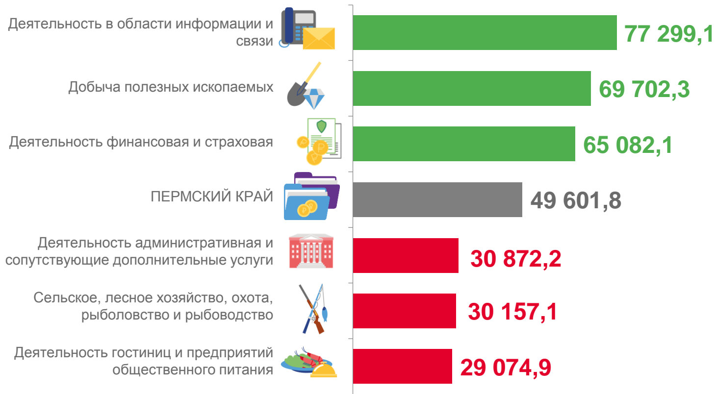
СРЕДНЕМЕСЯЧНАЯ НОМИНАЛЬНАЯ НАЧИСЛЕННАЯ ЗАРАБОТНАЯ ПЛАТА С НАИБОЛЬШИМИ И НАИМЕНЬШИМИ ЗНАЧЕНИЯМИ ПО ВИДАМ ЭКОНОМИЧЕСКОЙ ДЕЯТЕЛЬНОСТИ (рублей)